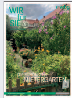
Das Titelbild dieser Ausgabe zielt ebenfalls das Bild eines Mietergartens, nämlich von Sevda Dinler aus der Würfelstraße.

A uch im Jahr 2024 wurden zahlreiche Vorschläge für den Wettbewerb „ Unsere Wohnanlagen sollen schöner werden “ eingereicht. Hierbei werden Mieterinnen und Mieter für ihre besondere Pflege von Außenflächen ausgezeichnet. Die Wettbewerbsjury, die unter anderem aus Expertinnen im Bereich Garten- und Landschaftsbau besteht, hat die neu eingereichten Bilder sorgfältig geprüft und miteinander verglichen, um schließlich die schönsten Arbeiten zu ehren.