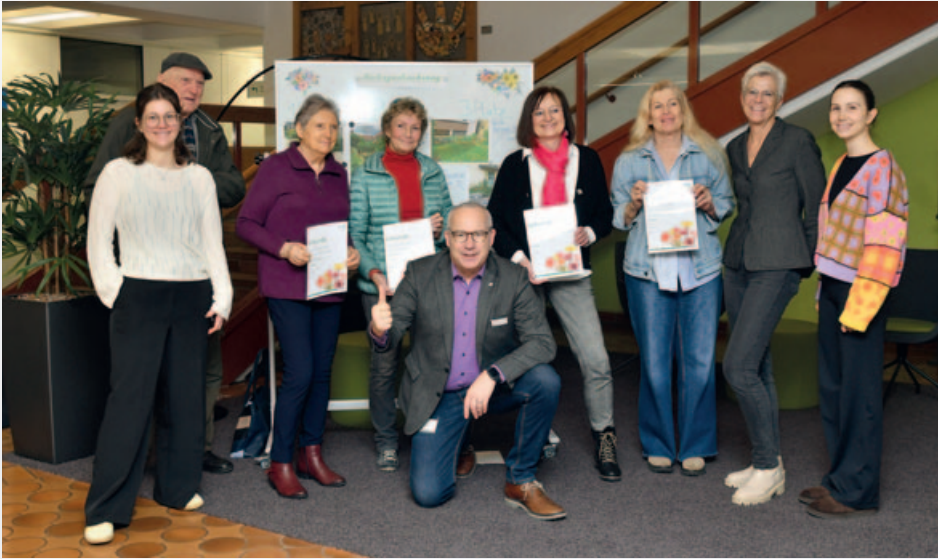
Die Gewinner und Mitglieder der Jury des Wettbewerbs bei der Übergabe der Urkunden in der wbg-Unternehmenszentrale.