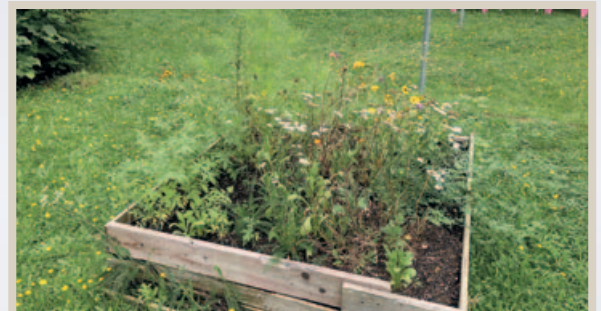
Die Drittplatzierte Birgit-Martina Waldeck stach mit ihrem Beitrag hervor. Sie hat die heilende Wirkung für Menschen und den Nutzen für Tiere der gepflanzten Kräuter und Blumen für Betrachterinnen und Betrachter schriftlich festgehalten.

A uch im Jahr 2024 wurden zahlreiche Vorschläge für den Wettbewerb „ Unsere Wohnanlagen sollen schöner werden “ eingereicht. Hierbei werden Mieterinnen und Mieter für ihre besondere Pflege von Außenflächen ausgezeichnet. Die Wettbewerbsjury, die unter anderem aus Expertinnen im Bereich Garten- und Landschaftsbau besteht, hat die neu eingereichten Bilder sorgfältig geprüft und miteinander verglichen, um schließlich die schönsten Arbeiten zu ehren.