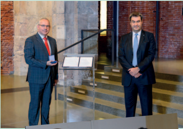
2021: Aushändigung des Ehrenzeichens des Bayerischen Ministerpräsidenten für Verdienste im Ehrenamt mit Bayerns Ministerpräsident Dr. Markus Söder.