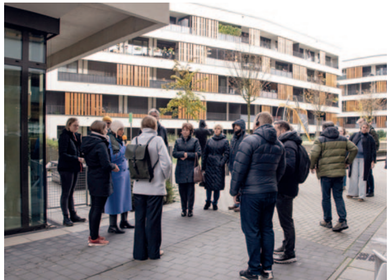
Die ukrainische Delegation schaute sich den Bestand der wbg Nürnberg an.

Die Teilnehmer der Studienreise betonten, wie wichtig diese Erfahrungen für die anstehenden Herausforderungen beim Wiederaufbau der ukrainischen Städte sind. //