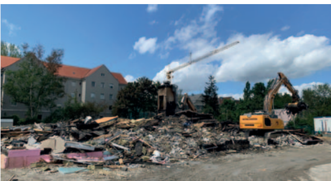
Es war ein schreckliches Szenario im Mai 2022, als die fast fertiggestellte Kindertagesstätte durch den Brand dem Erdboden gleichgemacht wurde.

Nun hat die WBG KOMMUNAL GmbH im Auftrag der Stadt mit dem identischen Wiederaufbau der zehngruppigen Einrichtung begonnen. Die Fertigstellung ist für November 2026 geplant, sodass die Kita ab dem Schuljahr 2027/28 Platz für insgesamt 250 Kinder bieten kann – 150 Hort- und 100 Kindergartenplätze. //