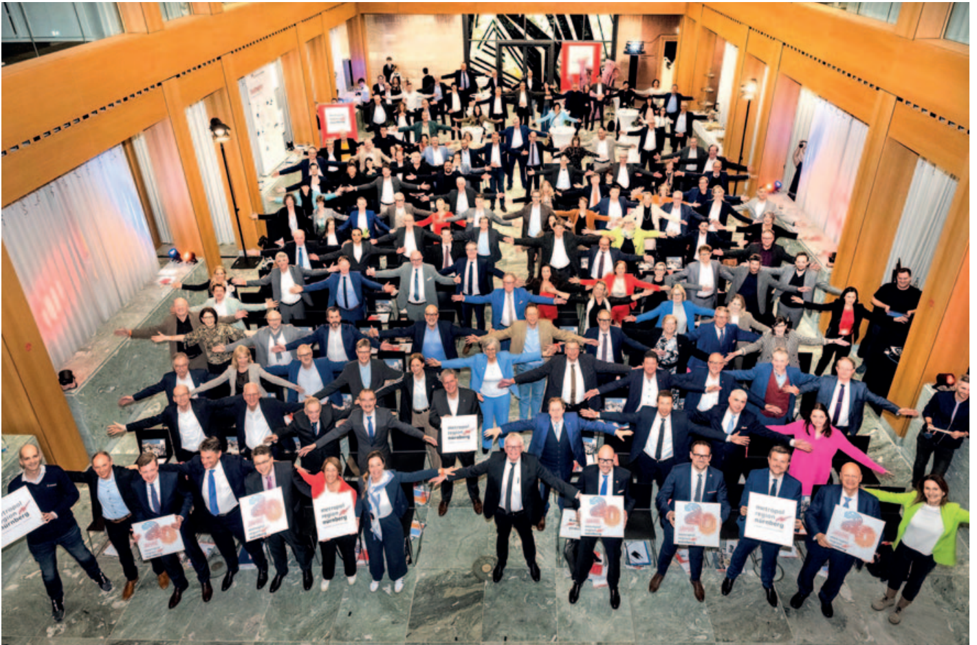
„Gemeinsam sind wir stärker“: Rund 200 Gäste feierten das Jubiläum in der IHK Nürnberg.